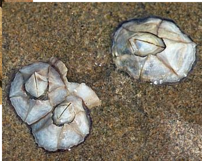
Breženka v skalah

Soline – ureja jih človek z namenom pridobivanja soli, organizmi so tu prilagojeni na zelo visoko slanost – primer sta solinski rakec in riba solinarka. V zvezek skiciraj ali skopiraj sliki.