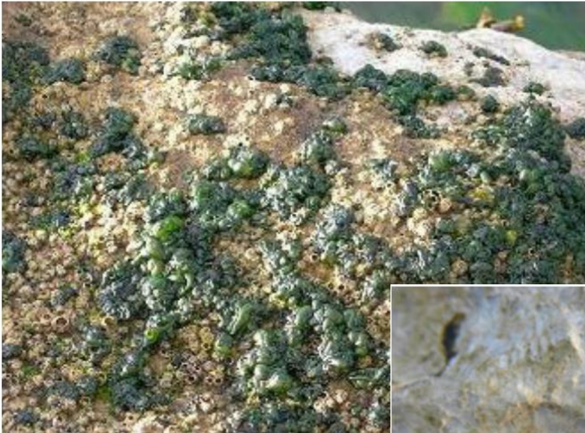
Kolonije modrozelenih bakterij