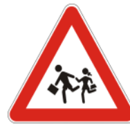
PAZI VOZNIK! OTROCI NA CESTI.