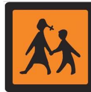
V AVTOBUSU SO OTROCI.