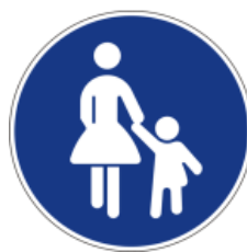
NAREDI TO. HODI PO STEZI ZA PEŠCE.