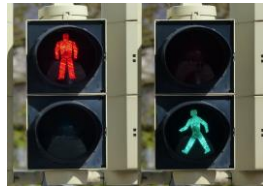
SEMAFOR ZA PEŠCE.