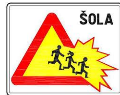
PAZI VOZNIK! V BLIŽINI JE ŠOLA.