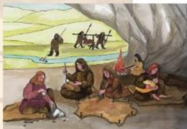
Moški na lovu, ženske pri delu