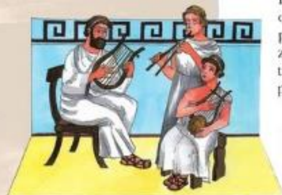
Najbolj razširjeni glasbili sta bili lira in avlos (dvojna piščal), poznali pa so tudi harfo in boben.

Ločitve zakona so bile redke. Družine so imele veliko otrok. Sinovi iz bogatejših družin so se šolali v tempeljskih šolah. Otroci kmetov in obrtnikov so se že zgodaj navajali na delo staršev. V Egiptu so lahko tudi ženske postale vladarice, kar kaže, da so bile precej enakopravne z moškimi.