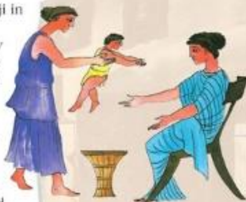
Dojilja podaja otroka materi.

Špartanska vzgoja je bila trda. Moški so bili v vojaški službi do šestdesetega leta, zato niso poznali pravega družinskega življenja. Špartanske ženske so bile veliko bolj neodvisne in vplivne kot v Atenah, pa tudi bolj enakovredne moškim.