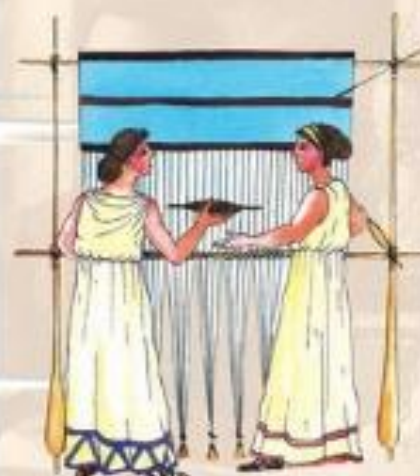
Ženski ob statvah