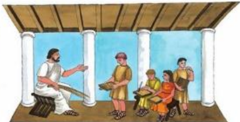
Rimski pedagog in otroci v šoli

Več izobrazbe so lahko pridobili otroci bogatejših staršev, ki so po osnovni šoli lahko nadaljevali šolanje gramatike in retorike (govornišva). Pri gramatiki so se učili grško in latinsko književnost. Grščino in govornišvo so Rimljani zelo cenili. Šele proti koncu rimske države je latinščina dobila uglednejše mesto.