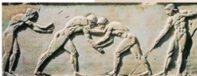
Med športi je bila zelo priljubljena rokoborba.