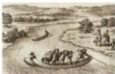
Pred gradnjo železnic je imel izjemen pomen rečni promet. Brodarstvo po Savi (risba je iz Valvasorjeve Slave vojvodine Kranjske) je zamrlo leta 1862 z gradnjo železniške proge od Zidanega Mostu do Siska.

V slovenskih deželah se je industrializacija uveljavljala počasneje kot v zahodnoevropskih državah in tudi počasneje kot drugod v habsburški monarhiji. Dokaj hitro pa so slovenske dežele zajele novosti v prometu, saj je bil strateški položaj ozemlja za to ugoden. Že leta 1818 je v Trst priplul prvi parnik, dvajset let zatem pa je zaplul tudi po Ljubljani. V monarhiji se je hitro pojavila potreba po železniški povezavi med Dunajem in Trstom, ki je bil pomembno pristanišče. Južna železnica je bila preko današnjega slovenskega ozemlja zgrajena v dobrem desetletju in prvi vlak je pripeljal v Trst leta 1857. Pomembna je bila tudi Bohinjska proga od Beljaka (oziroma Prage) do Trsta, ki je bila zgrajena leta 1906. Ob progi so rasla mesta in industrijski objekti. V tem obdobju so začeli delovati zasavski premogovniki, nastale so nekatere tekstilne tovarne in papirnice (Vevče). Nove prometne povezave in industrijski objekti so prinesli zaposlitve in nove razvojne priložnosti, obenem pa povzročile zamiranje fužinarstva, furmanstva in nekaterih obrti, ki niso mogle konkurirati novim oblikam proizvodnje in prometa. Tudi kmetijstvo v tem času ni dovolj napredovalo, saj so bili kmetje obremenjeni z davki in stroški za modernizacijo. Mnogo kmetij je propadlo, kmetje pa so začeli iskati delo v tovarnah. Kljub gospodarskemu napredku so bile slovenske dežele še vedno v velikem razvojnem zaostanku za večino dežel monarhije.