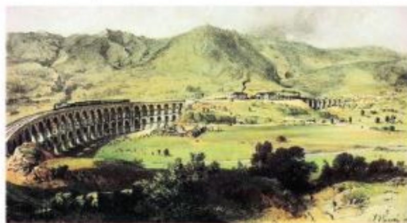
28. oktobra 1856 je pripeljal prvi vlak do Borovnice, kjer je bil zgrajen eden največjih viaduktov v Evropi. Gradili so ga 6 let, na najvišji točki je bil visok 38 metrov, njegova dolžina je bila 561 metrov.

V slovenskih deželah se je industrializacija uveljavljala počasneje kot v zahodnoevropskih državah in tudi počasneje kot drugod v habsburški monarhiji. Dokaj hitro pa so slovenske dežele zajele novosti v prometu, saj je bil strateški položaj ozemlja za to ugoden. Že leta 1818 je v Trst priplul prvi parnik, dvajset let zatem pa je zaplul tudi po Ljubljani. V monarhiji se je hitro pojavila potreba po železniški povezavi med Dunajem in Trstom, ki je bil pomembno pristanišče. Južna železnica je bila preko današnjega slovenskega ozemlja zgrajena v dobrem desetletju in prvi vlak je pripeljal v Trst leta 1857. Pomembna je bila tudi Bohinjska proga od Beljaka (oziroma Prage) do Trsta, ki je bila zgrajena leta 1906. Ob progi so rasla mesta in industrijski objekti. V tem obdobju so začeli delovati zasavski premogovniki, nastale so nekatere tekstilne tovarne in papirnice (Vevče). Nove prometne povezave in industrijski objekti so prinesli zaposlitve in nove razvojne priložnosti, obenem pa povzročile zamiranje fužinarstva, furmanstva in nekaterih obrti, ki niso mogle konkurirati novim oblikam proizvodnje in prometa. Tudi kmetijstvo v tem času ni dovolj napredovalo, saj so bili kmetje obremenjeni z davki in stroški za modernizacijo. Mnogo kmetij je propadlo, kmetje pa so začeli iskati delo v tovarnah. Kljub gospodarskemu napredku so bile slovenske dežele še vedno v velikem razvojnem zaostanku za večino dežel monarhije.